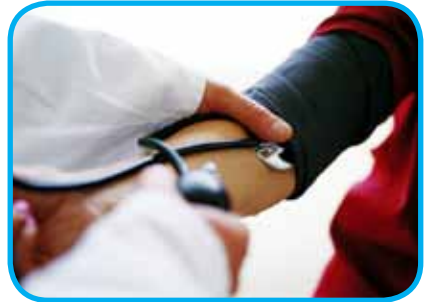
کاهش مصرف نمک، مقرون به صرفه ترین راه حل کاهش فشار خون است

◀ تجربه کشورهای موفق نشان می دهد با کاهش مصرف نمک در جامعه، هزینه های درمانی کاهش قابل توجهی یافته است.